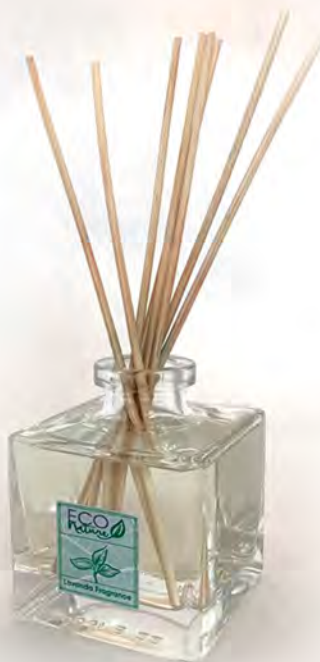
In vetro da 500 ml con 8 midollini confezione da 4 diffusori