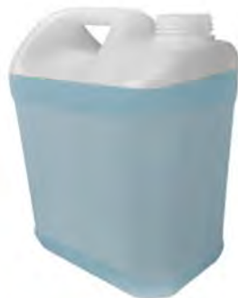
Refill in tanica da 5 litri TERMALE alla Brezza Marina Vendita in singola tanica