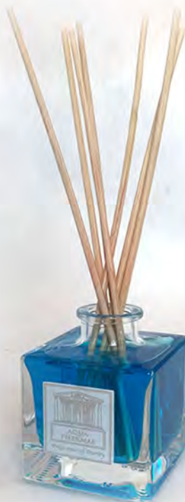
In vetro da 500 ml con 8 midollini confezione da 4 diffusori