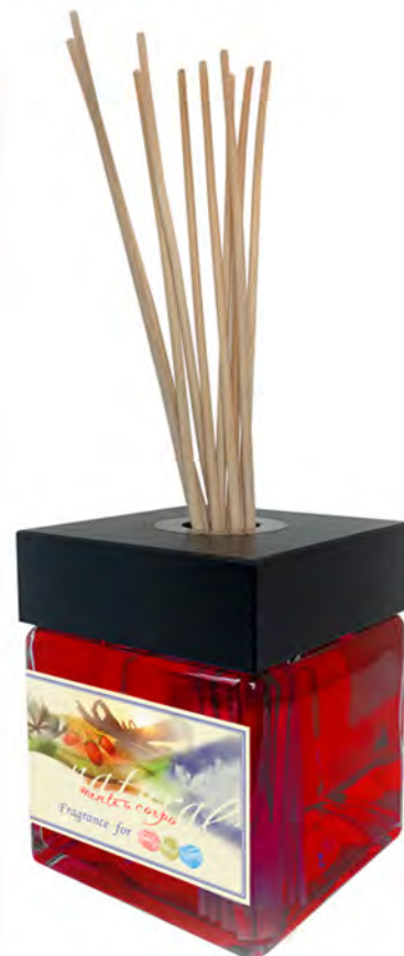
In vetro da 2,5 litri (Hall) con 8 midollini 60 cm di base (singolo)