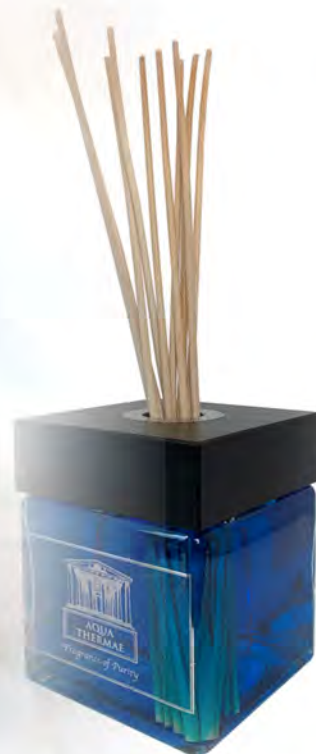
In vetro da 2,5 litri (Hall) con 8 midollini 60 cm di base (singolo)