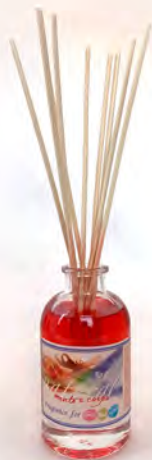
In vetro da 100 ml con 5 midollini confezione da 10 diffusori