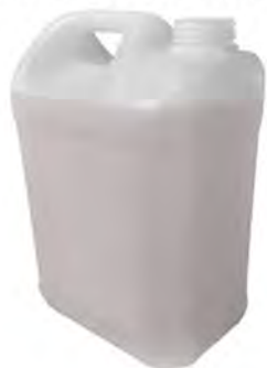
Refill in tanica da 5 litri NATURALMENTE Vendita in singola tanica