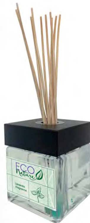
In vetro da 2,5 litri (Hall) con 8 midollini 60 cm di base (singolo)