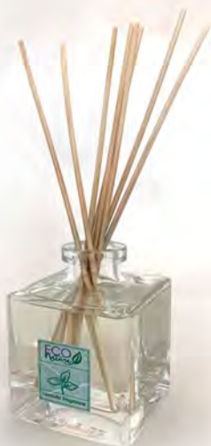
In vetro da 100 ml con 5 midollini confezione da 10 diffusori