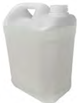
Refill in tanica da 5 litri ECO NATURE Vendita in singola tanica