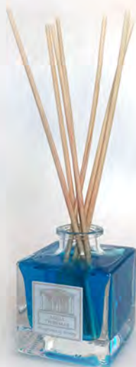
In vetro da 100 ml con 5 midollini confezione da 10 diffusori