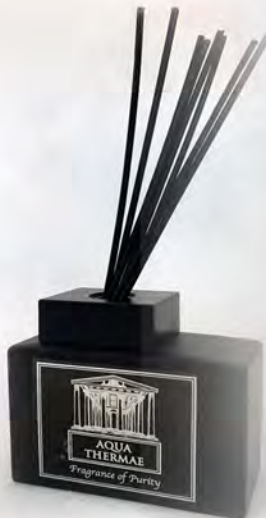
In vetro da 200 ml con 8 midollini confezione da 6 diffusori