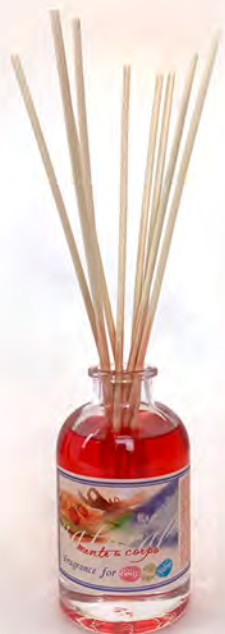
In vetro da 200 ml con 8 midollini confezione da 6 diffusori